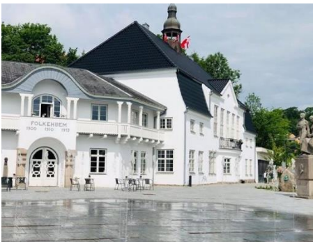
Folkehjem og Genforeningspladsen