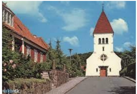
Æ Lillekirk (Sct. Jørgens), Aabenraa