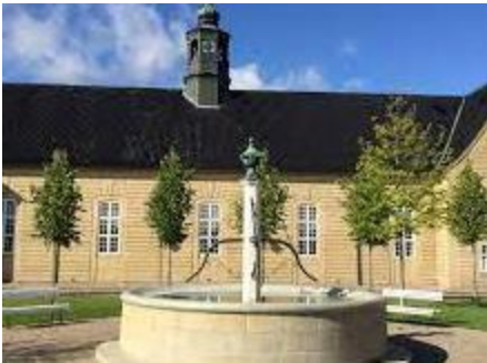
Salshuset i Christiansfeld